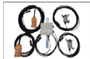
■手動運転リミットスイッチ