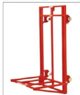
■台車アオリ L500 (補強付) H1055×W650×D500